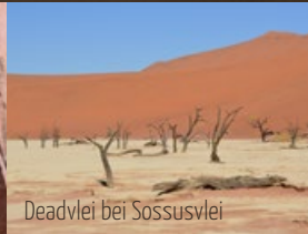
Deadvlei bei Sossusvlei